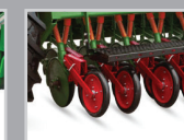
Резиновое Нажимное Колесо Для Двухдисковой Сеялки