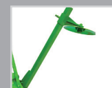
Гидравлические Боковые Маркеры