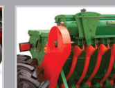
Бункер для семян Микрогранул